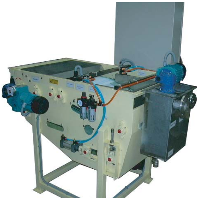
FP-006 單濾帶式污泥脫水機